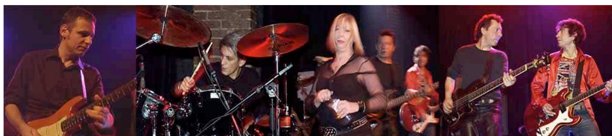
Live à la Maroquinerie – 13 janvier 2004

Comme ce concert fut un moment exceptionnel, ils décident de remettre ça le 17 avril 2005 , à nouveau à la MAROQUINERIE avec de nombreux invités.